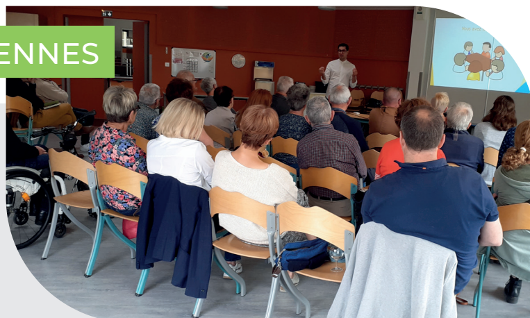
Réunion secteur Deux Vallées/route de Soucelles/Guichardière présentation du rôle de la police municipale

Vous avez des questions, vous souhaitez faire des propositions et vous habitez le quartier alors ces rencontres sont faites pour vous !